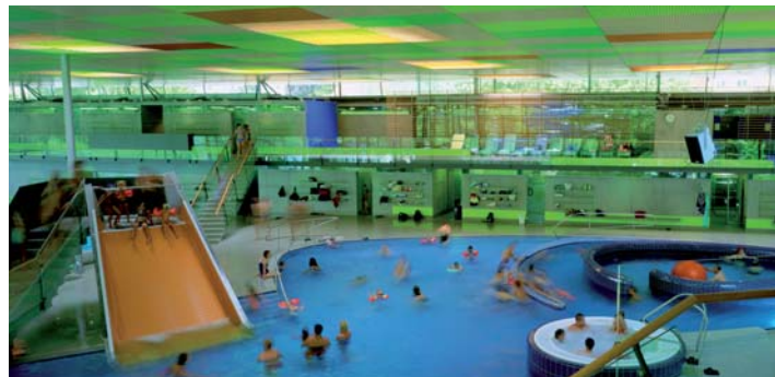
TuWass Freizeit- und Thermalbad Tuttlingen

Neubau eines Thermal- und Solebades mit Sauna, Fitness- und Wellnessbereich, Restaurant und Shop.