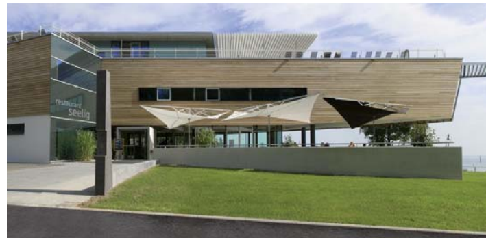
Bodensee Therme Konstanz

Neubau eines Thermal- und Freibades mit Saunaanlage und Restaurant.