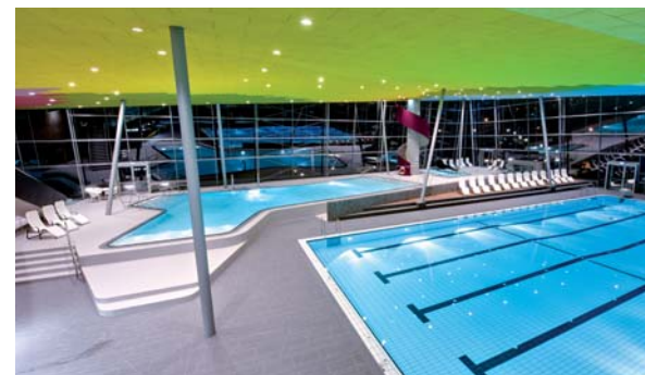
Syrdall Schwëmm in Niederanven, Luxemburg

Neubau eines interkommunalen Freizeitbades mit Sport-, Erlebnis-, und Außenbecken, Rutsche sowie Saunalandschaft und Wellnessbereich.