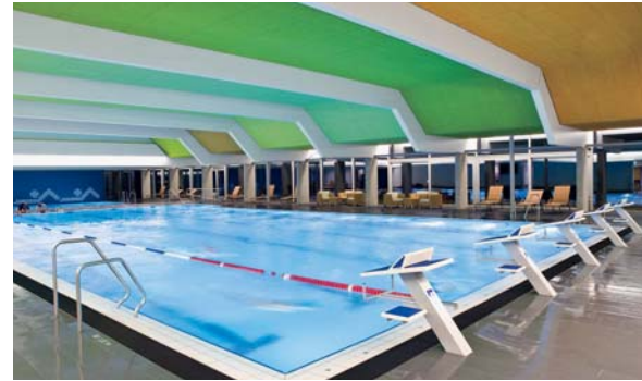
Hallenbad Bad Saulgau

Sanierung und Erweiterung eines Sport-Hallenbades aus den 1970er Jahren.