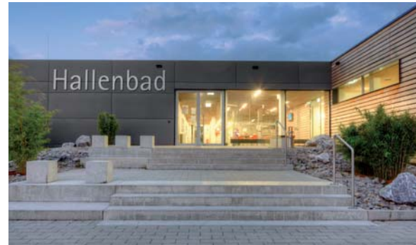
Hallenbad Mengen mit Sporthalle

Sanierung und Umbau der drei Gebäudebereiche Hallenbad, Saunabereich und Sporthalle nach einem Gebäudebrand im Januar 2009.