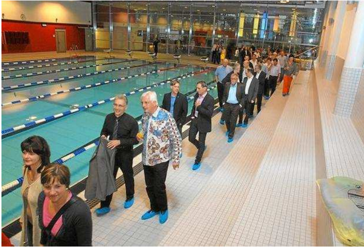
Die ersten Gäste kommen. Für den offiziellen Part öffnete Ahlens neues Parkbad schon am Abend. 130 Besucher waren schlichtweg begeistert.