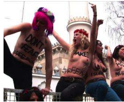
"Oben-ohne-Dschihad" gegen Islamismus