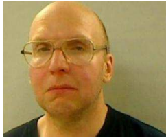
Mann lebte fast 30 Jahre allein im Wald