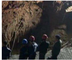
Überwachungskamera filmt tragischen Unfall

Time-People GmbH Personaldienstleistung Zeitarbeit mit Herz www.time-people.de