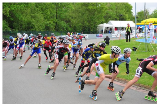
Foto: Europacup in Groß-Gerau 2013

Speedskaten ist der Begriff für schnelles Inlineskaten mit dem Ziel eine Strecke in möglichst kurzer Zeit zu bewältigen. Dabei ist neben der körperlichen Fitness vor allem eine gute Technik ausschlaggebend. Speedskaten auf einer Bahn ist sehr gut mit dem Eisschnelllauf (engl. Speedskating) zu vergleichen. Viele Wettkämpfe finden auf einer Rundbahn mit überhöhten Kurven statt. Dabei gibt es im Gegensatz zum Eisschnelllauf weniger Einzelzeitfahrten, und mehr Wettkämpfe die in sogenannten Massenstarts durchgeführt werden.