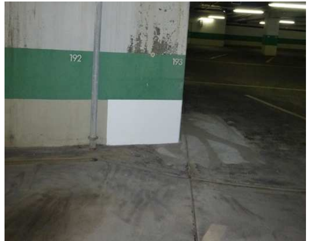
Sichtfenster Boden geschlossen