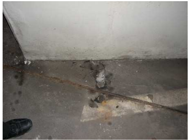
Rohre als Trennfuge