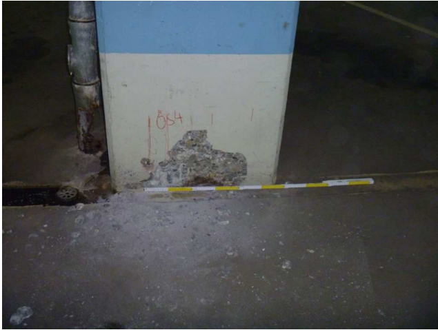
Übergang Boden Stütze