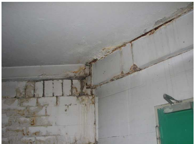
Kalksandsteinwände + Auflager