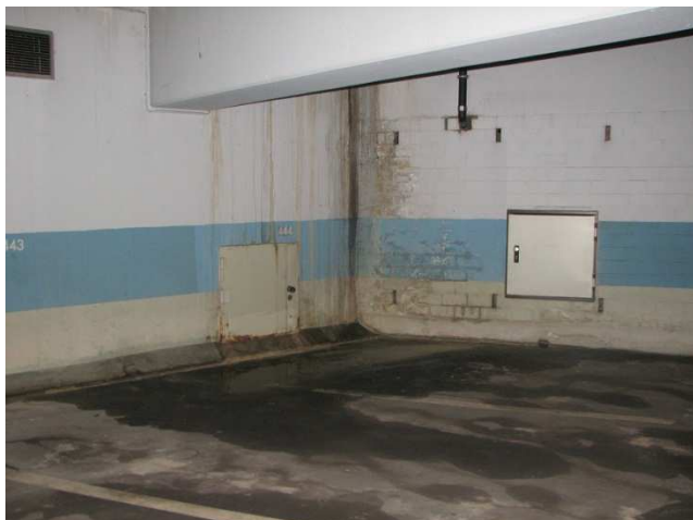
Pfützenbildung + Kalksandsteinwände + Türen