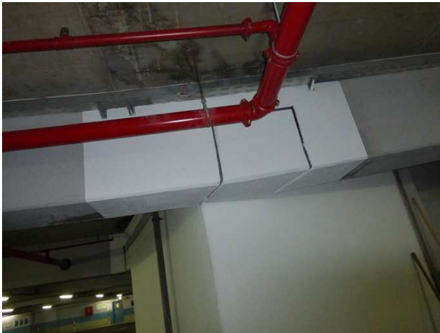
Auflager wiederhergestellt (saniert)