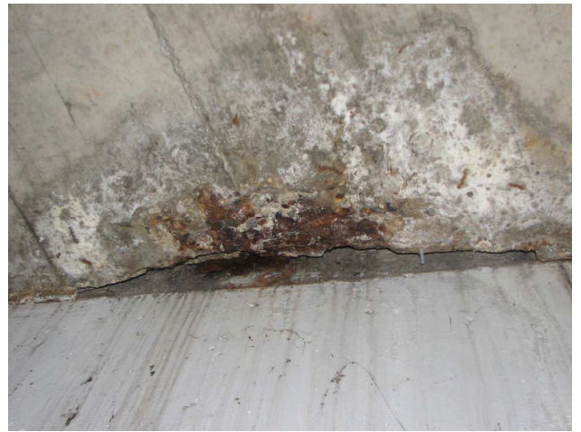
Auflager Decke Treppenhauskern