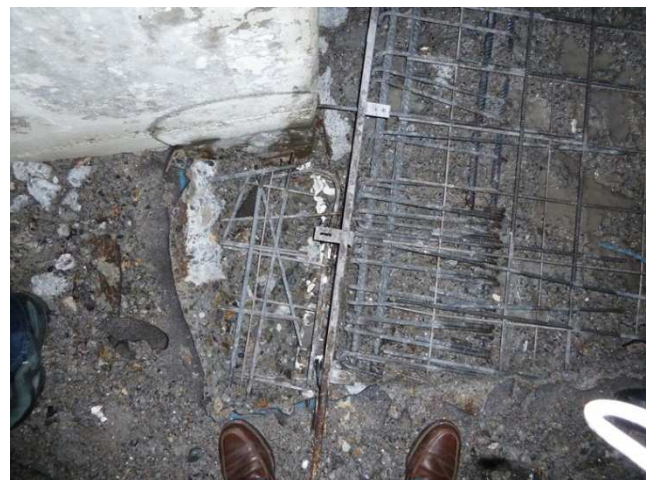
Sichtfenster Boden geöffnet