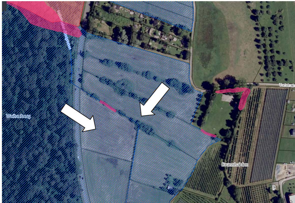
Lageplan Maßnahmenflächen Fl. St. Nr. 184 + 1784, Gemarkung Raderach Blau schraffiert = FFh-Gebiet Nr. 8221342 'Bodenseehinterland zwischen Salem + Markdorf'