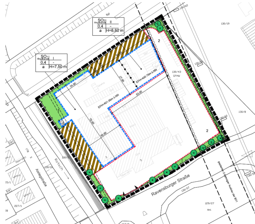
Ursprungsplan Nr. 189