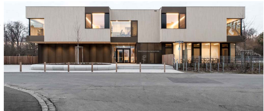
Kinderhaus im Riedlepark, Energiekonzept PV-Anlage + Wärmepumpe