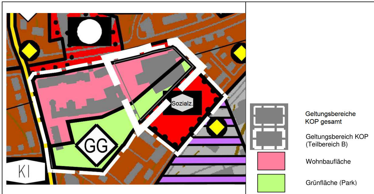
Abb. 3: Künftige Darstellung FNP, 7. FNP-Änderung (hier: Berichtigung)