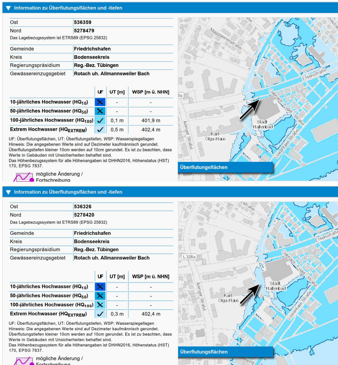
Abb. 4: Ausschnitt Hochwassergefahrenkarte BW

Der Großteil des Teilbereichs B liegt außerhalb des festgesetzten Überschwemmungsgebiets des 100-jährigen Hochwassers der Rotach (HQ100-Überflutungsbereich). Im nördlichen Bereich bis ca. 8 m südlich der Ehlersstraße ist gemäß Hochwassergefahrenkarte (LUBW) ein Bereich betroffen, für den Überflutungstiefen von ca. 10 cm im HQ100 und 50 cm im HQExtrem prognostiziert sind. Des Weiteren liegt im Westen des Plangebietes eine HQExtrem Fläche, die eine Überflutungstiefe von bis zu 30 cm erreicht. Überlagert man diese Flächen mit den festgesetzten überbaubaren Grundstücksflächen des Bebauungsplans (Baugrenze und Flächen für Tiefgaragen) ergeben sich folgende beeinträchtigte Flächen bzw. Volumen: