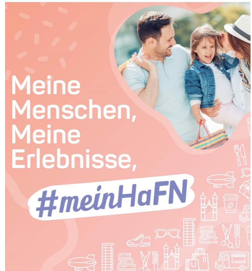
Kampagnenmotiv zur Begleitung der Öffnungsschritte nach dem Lockdown